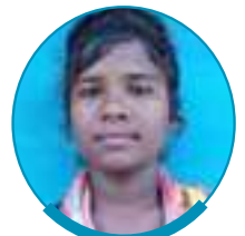
सकरो मार्जी वेबको इंडिया एल