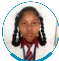
पूर्णमा बास्के वेबको इंडिया एल