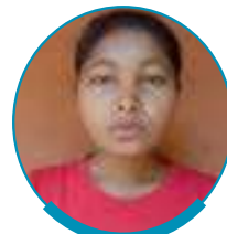
सोनाली मुर्मू वेबको इंडिया एल