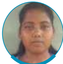
चिता महली मल्टीटेक ऑटो पी.एल

प्रोजेक्ट RAAH के तहत ITI पूरा होने के बाद KGBV, पोटका के 6 छात्रों को रोजगार प्राप्त हुआ