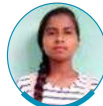
गंगा सरदार वेबको इंडिया एल