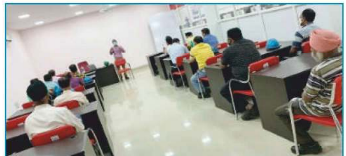
गतिविधियों की सूची एवं मैन-मशीन इंटरफेस गतिविधियों की पहचान

SOP पर ट्रेनिंग, जॉब साइकिल चेक (JCC), टीम लीडर और डिप्टी लीडर्स के लिए मैन-मशीन इंटरफेस सम्बंधित ट्रेनिंग का आयोजन किया गया, JCC के माध्यम से SOP में परिशोधन, SOP का ऑडियो-विजुअल मॉड्यूल की तैयारी, SOP का स्थानीय भाषा में रूपांतरण, कौमोनली एक्सेप्टेड अनसेफ प्रैक्टिस को निष्काषित करना आदि, विभिन्न प्रकार के गतिविधियों को आयोजित किया गया।