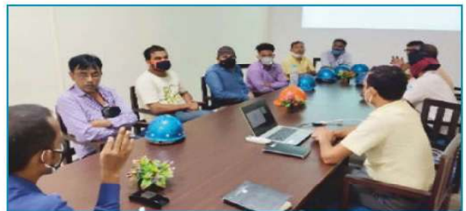
सुरक्षा अभियान पर जागरूकता प्रशिक्षण