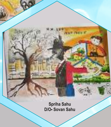
Spriha Sahu D/O- Sovan Sahu